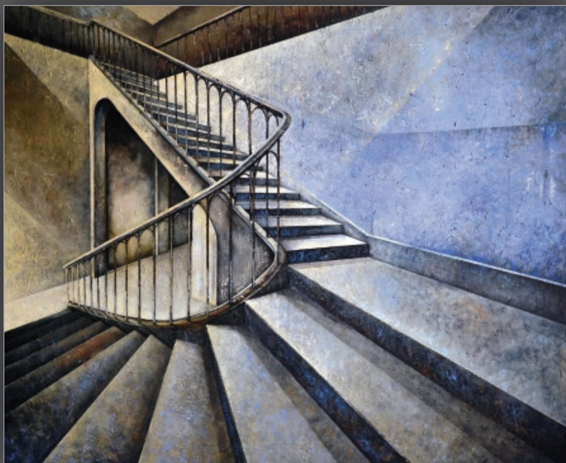
1 CHĘĆ POZNANIA akryl, płótno, 100 x 120 cm