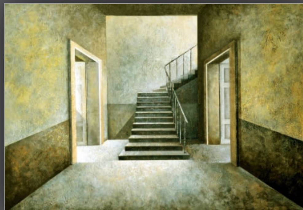
6 MOŻLIWOŚCI II