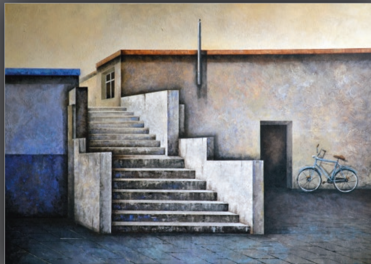
2 CIEKAWOŚĆ II akryl, płótno, 100 x 140 cm