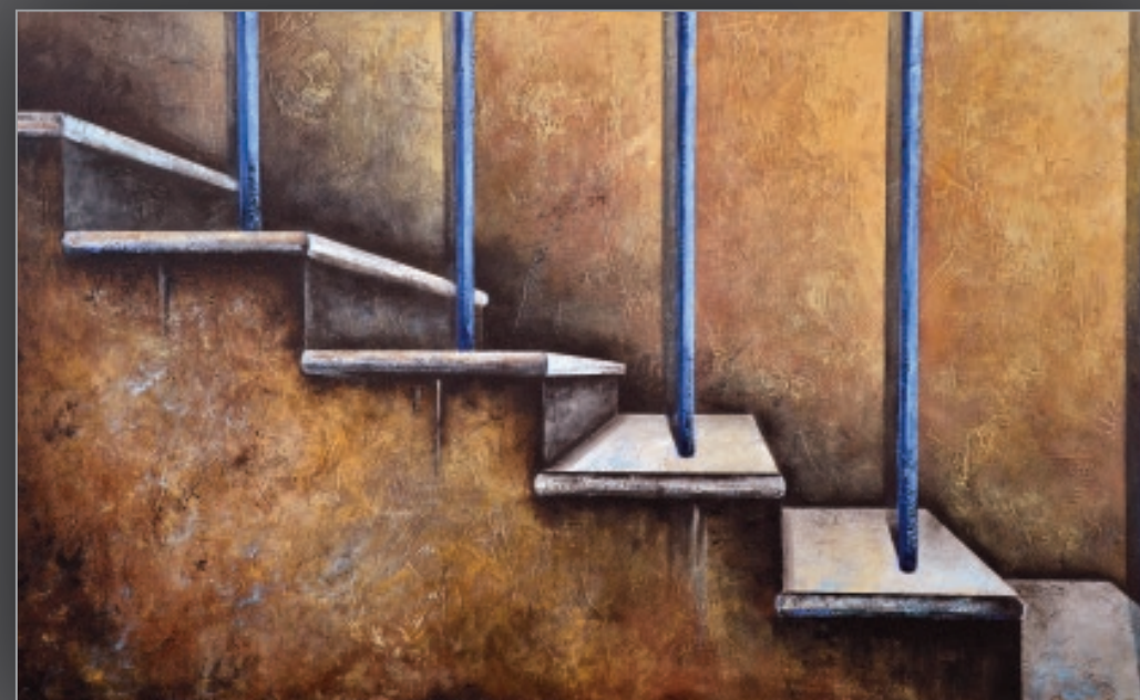
10 RYTM akryl, płótno, 50 x 80 cm