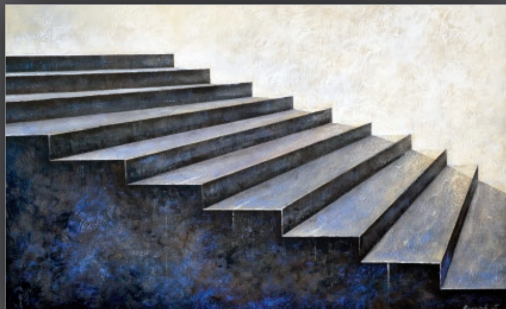
9 POWTARZALNOŚĆ akryl, płótno, 50 x 80 cm