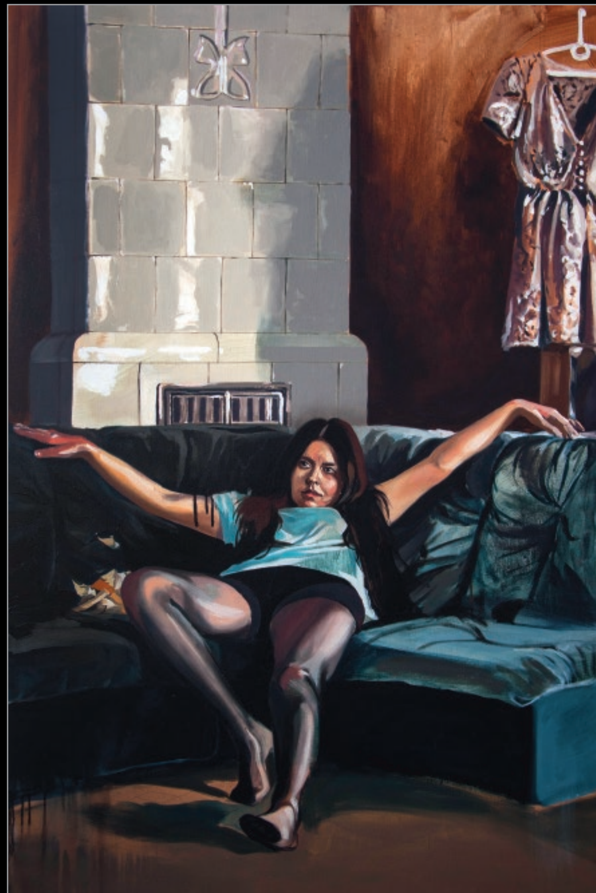
Zejście, 2014 olej, płótno, 120 x 80 cm 12