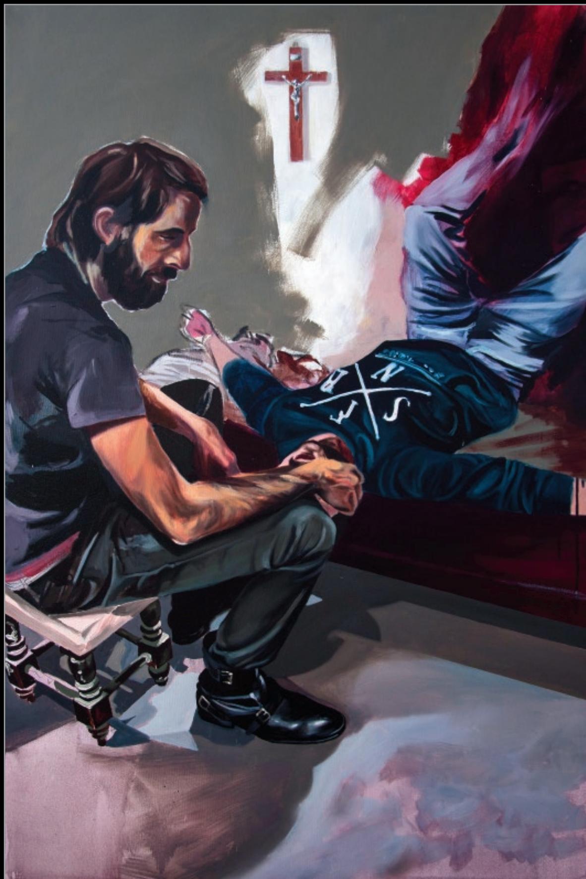
11 Postuszeństwo, 2013 olej, płótno, 120 x 80 cm