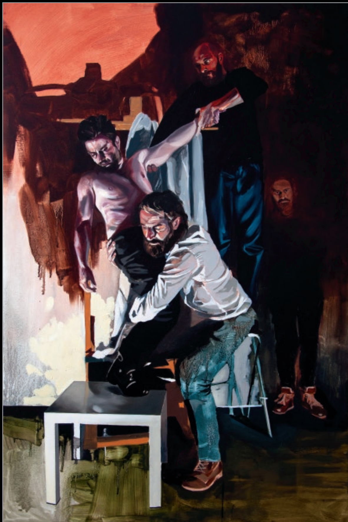
13 Zdjęcie z krzyża, 2014 olej, płótno, 120 x 80 cm