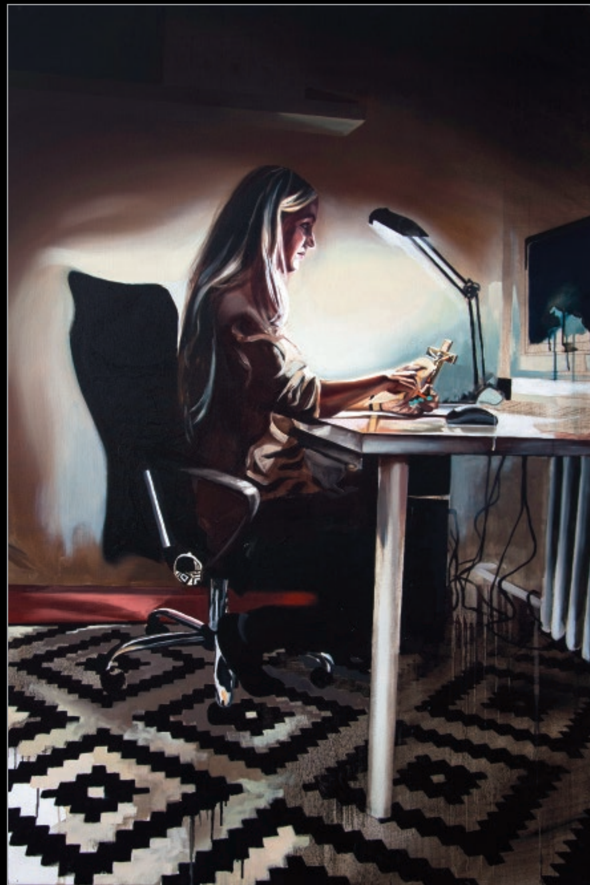
Pamiętka, 2013 olej, płótno, 120 x 80 cm