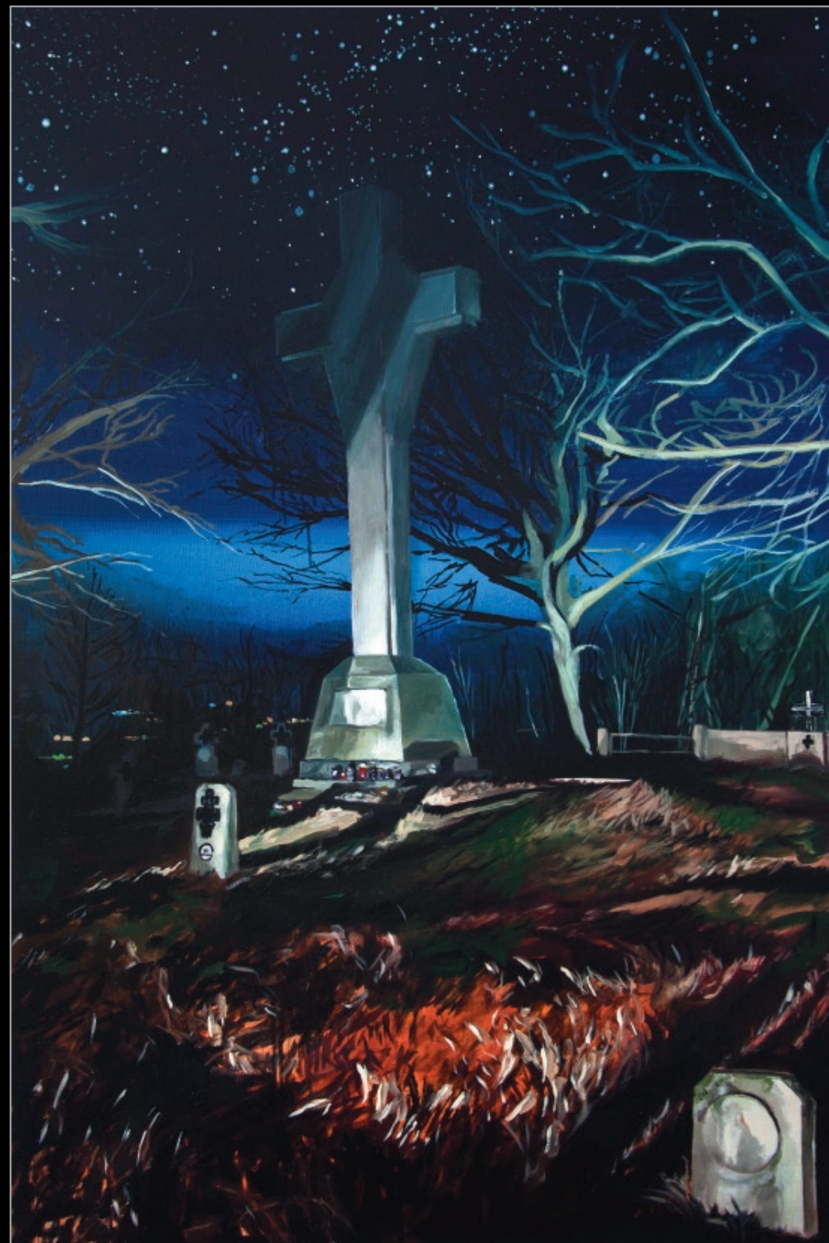
XIV, 2014 olej, płótno, 120 x 80 cm 14