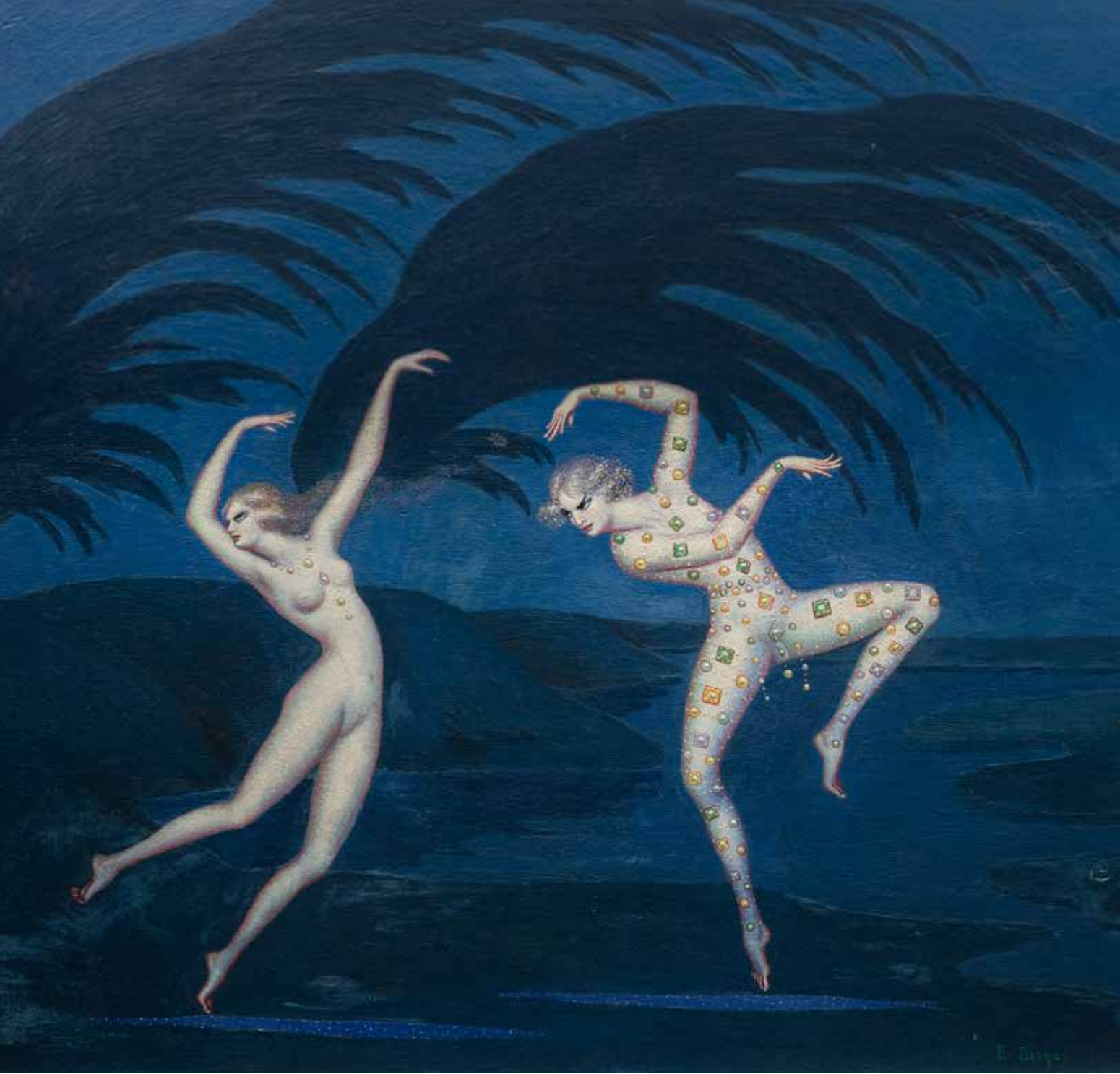
Bolesław Biegas (1877–1954), Taniec huraganu , 1927 r., olej, deska, 60 × 75 cm, sygn. u dołu: B. Biegas